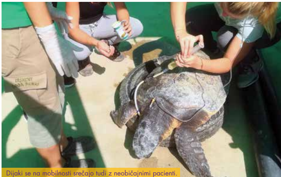
Dijaki se na mobilnosti srečajo tudi z neobičajnimi pacienti.

Pri izvajanju programa veterinarski tehnik skrbimo tudi za mobilnost naših dijakov in za pridobivanje praktičnih znanj v tujini. Šola je vključena v evropsko združenje šol za veterinarske tehnike Vetnet ter program Erasmus+, zato naši dijaki skupaj z mentorji veterinarji opravljajo praktični pouk na Cipru, Irskem, Češkem, Švedskem, Finskem, v Španiji, Bosni in Hercegovini ter na Kosovu.