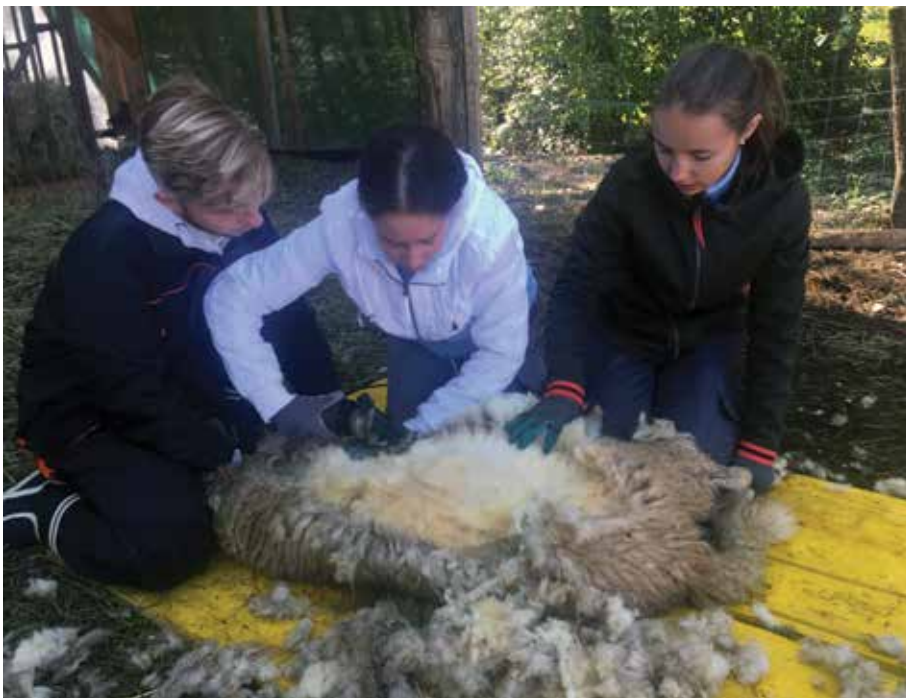
Biotehniški izobraževalni center Ljubljana

VETERINARSKA TEHNOLOGIJA je strokovni modul, ki dijake seznanja s pogoji in vzroki nastanka bolezni, z najpomembnejšimi boleznimi domačih živali, s preventivnimi ukrepi; s temelji mikrobiologije in parazitologije, farmakologije, prve pomoči, kirurgije in z glavnimi veterinarsko tehničnimi deli. V ta modul je vključeno veliko praktičnega dela, ki se izvaja v azilu za zapuščene živali, živalskem vrtu in na terenu.