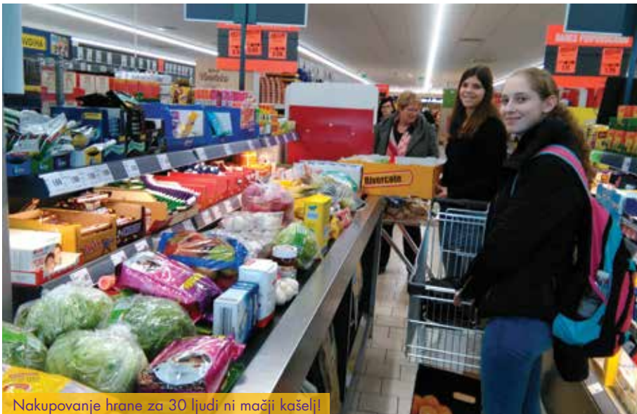
Nakupovanje hrane za 30 ljudi ni mačji kašelj!

Bivanje in gibanje v naravi: že samo bivanje zunaj naselja, na samem, v lovski koči z obsežnim zunanjim prostorom s klopmi, »jurčkom« (z lesom obit prostor, v katerem je večje odprto kurišče, kjer se lahko družimo zvečer ob vsakem vremenu), obdani z gozdom, je pravo doživetje. Ne glede na glavni del programa se z dijaki obvezno odpravimo na pohod v okolico in tudi sicer večino časa prebijemo zunaj.