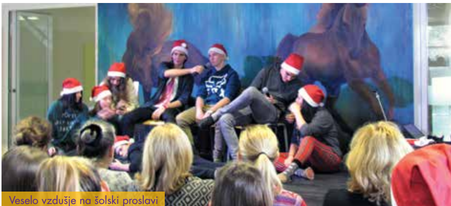
Veselo vzdušje na šolski proslavi

Dijaška skupnost Gimnazije in veterinarske šole (DS GVŠ) je skupnost vseh oddelkov na šoli. Njena osnovna funkcija je zastopati interese dijakov GVŠ. Na sestankih, ki potekajo enkrat mesečno, se dijaki pogovarjajo o dejavnostih na šoli in zunaj nje, izpostavljajo aktualne probleme na šoli, pripravljajo pa tudi raznorazne projekte, kot so natečaji ipd. Skupnost vsako leto organizira novoletno in pustno prireditev in tako popestri dogajanje na šoli. Šolska dijaška skupnost se vključuje tudi v DSL (Dijaška skupnost Ljubljana) in DOS (Dijaška organizacija Slovenije).