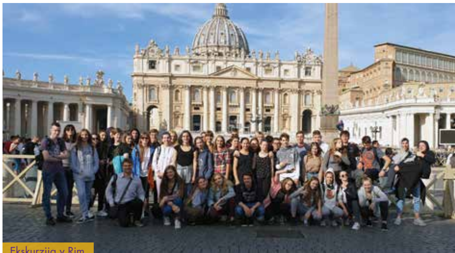
Ekskurzija v Rim

Pomemben del pouka predstavljajo eno- in večdnevne ekskurzije (Italija, Madžarska, Poljska, Francija, Belgija ...), ki jih organizirajo profesorji strokovnih modulov, slovenščine in zgodovine. Tako dijaki spoznajo dobršen del naše domovine, potujemo pa tudi v tujino. Cilj ekskurzij je poleg poglobljanja strokovnih znanj tudi druženje z medsebojnim spoznavanjem, zato so pri dijakih zelo priljubljene.