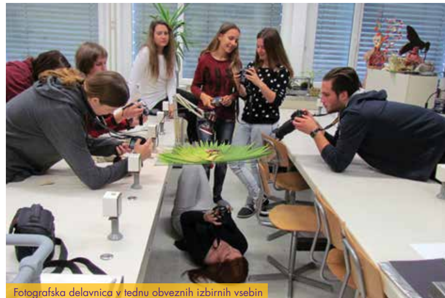
Fotografska delavnica v tednu obveznih izbirnih vsebin

Obvezne izbirne vsebine in interesne dejavnosti se delijo na obvezni del in prosto izbiro.