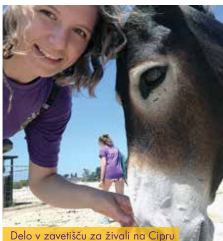
Delo v zavetišču za živali na Cipru