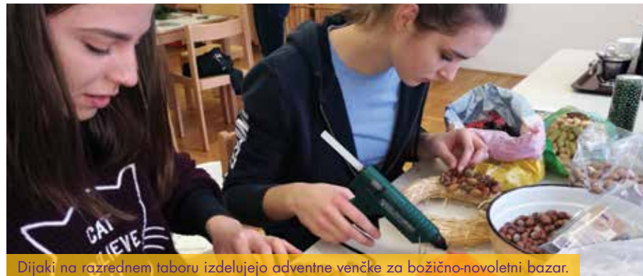
Dijaki na razrednem taboru izdelujejo adventne venčke za božično-novoletni bazar.

Od leta 2005 se predstavljamo pod imenom Biotehniški izobraževalni center Ljubljana s štirimi organizacijskimi enotami: Gimnazija in veterinarska šola, Živilska šola, Višja strokovna šola ter Središče za izobraževanje odraslih kot del Medpodjetniškega izobraževalnega centra. Enote delujejo na več lokacijah, in sicer v Mestnem logu, na lžanski cesti in v Šentvidu pri Ljubljani. V Mestni log, kjer domuje tudi Gimnazija in veterinarska šola, se vpisujejo učenci iz vse Slovenije, zato na naših hodnikih in v učilnicah slišimo vse narečne govornice.