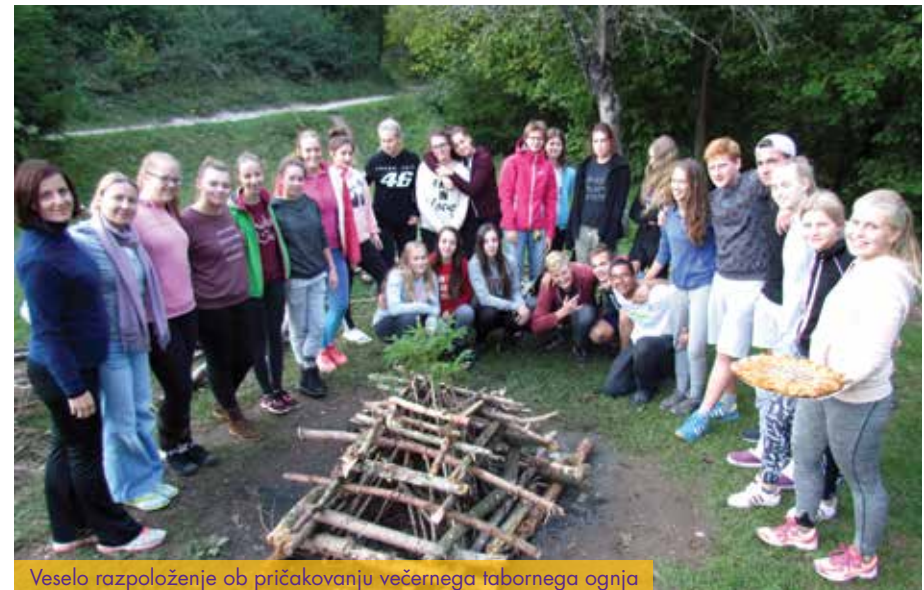
Veselo razpoloženje ob pričakovanju večernega tabornega ognja

Poleg navedenega nudijo razredni tabori izredne možnosti medpredmetnega povezovanja, zato razredne vikende izkoristimo tudi za to. Vedno je eden od vključenih predmetov naravoslovni, saj tabor omogoča terensko delo. Na taboru največkrat izvajamo tudi športne dejavnosti: pohode, tek, balinanje, badminton, veslanje, pohodništvo.