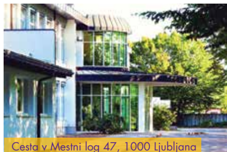
Cesta v Mestni log 47, 1000 Ljubljana