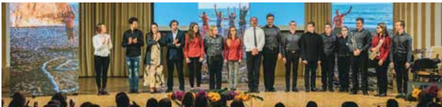
Nastopajoči nekdanji in sedanji dijaki na slavnostni akademiji ob sedemdesetletnici BIC Ljubljana

Gimnazija in veterinarska šola domuje v enem najbolj prijetnih območij Ljubljane, v Mestnem logu, ob Veterinarskih klinikah. Ne obkrožajo je prometne ceste, ne moti nas hrup z ulice; obdaja jo zelenje, ob njej so pašniki, na katerih se pasejo ovce in konji. Senco ji dajejo stara drevesa in tudi tradicija šole sega daleč v preteklost.