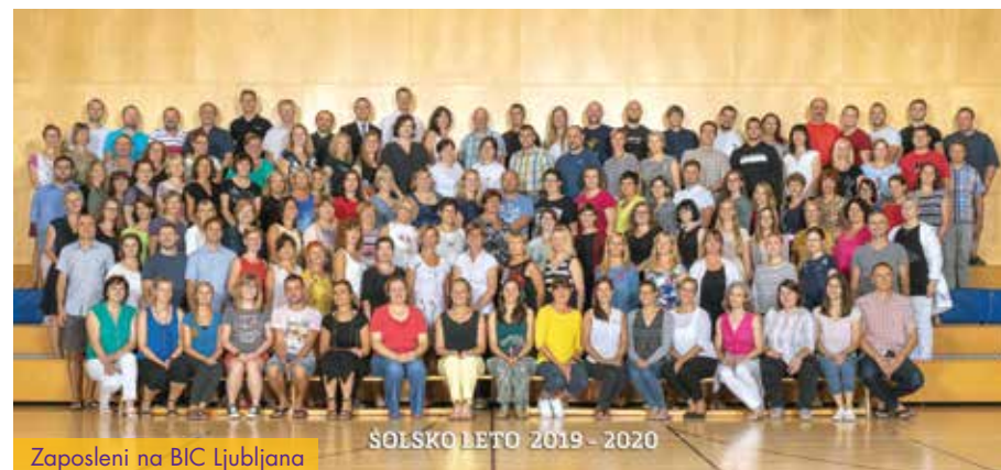
Zaposleni na BIC Ljubljana