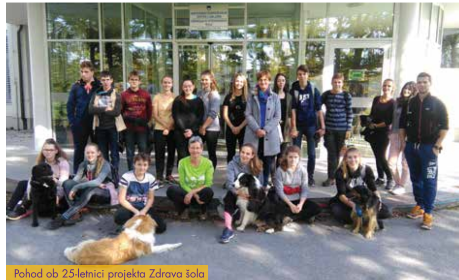
Pohod ob 25-letnici projekta Zdrava šola