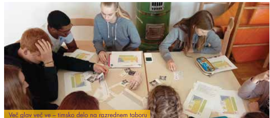
Več glav več ve – timsko delo na razrednem taboru

Razredni tabor je dobesedno »učilnica brez katedra« oz. gre za odprto učno okolje.