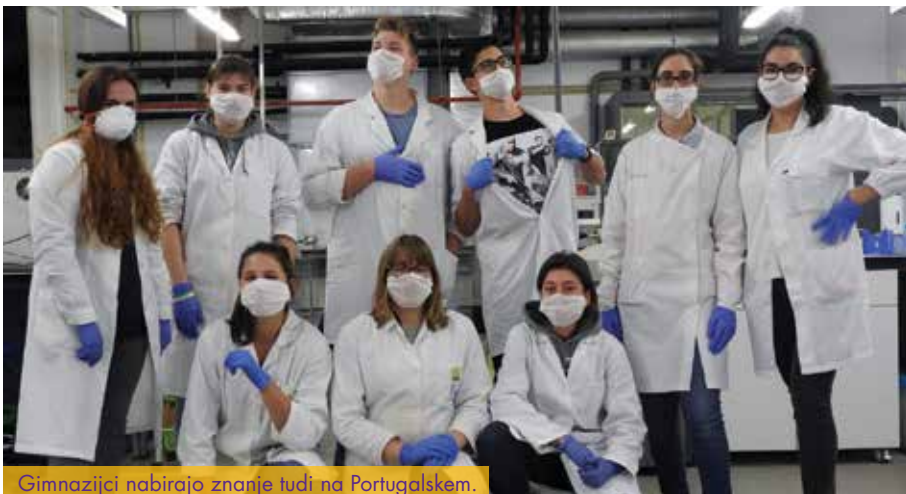
Gimnazijci nabirajo znanje tudi na Portugalskem.

Skupaj s profesorji se udeležujejo tudi mednarodnih konferenc in izobraževanj na temo biotehnoške znanosti.