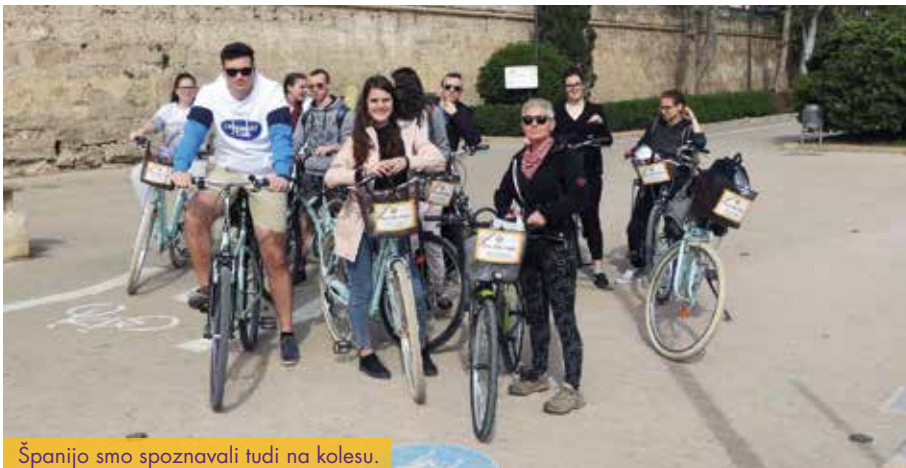
Španijo smo spoznavali tudi na kolesu.

Projekt mobilnosti za dijake tehniške gimnazije je začel teči decembra 2015. Dijaki nova znanja pridobivajo v laboratorijih in izobraževalnih ustanovah, ki izvajajo programe, podobne našim. Strokovno se izpopolnjujejo v Španiji, na Finskem, Portugalskem in Poljskem. Ob strokovnem delu spoznavajo tudi naravno in kulturno dediščino dežel, ki jih obiščejo.