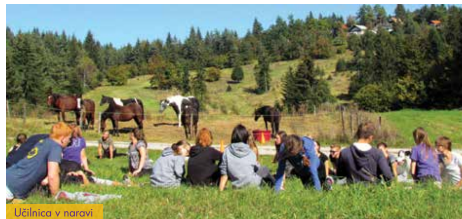
Učilnica v naravi

Dosegamo pozitivne vplive neformalnega druženja dijakov in profesorjev; ustvarijo se posebni odnosi, ki se ohranijo vsa leta šolanja. Dijaki imajo v šoli drugačen odnos tako do sošolcev kot do učiteljev.