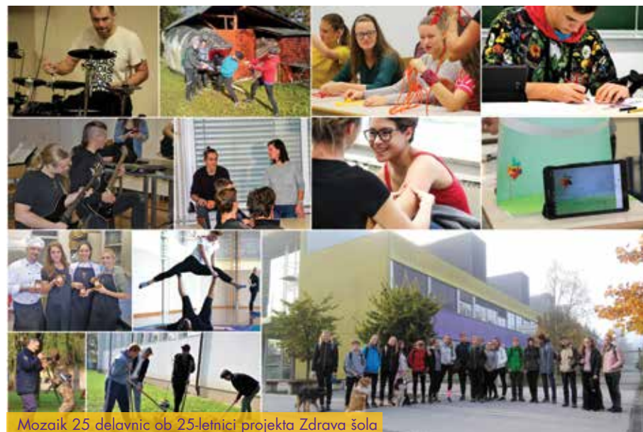
Mozaik 25 delavnic ob 25-letnici projekta Zdrava šola

V naravovarstvenih projektih se dijaki udeležujejo različnih posvetov in dejavnosti v zvezi z mokrišči, s preučevanjem ptic, problematiko onesnaževanja voda in okolja.