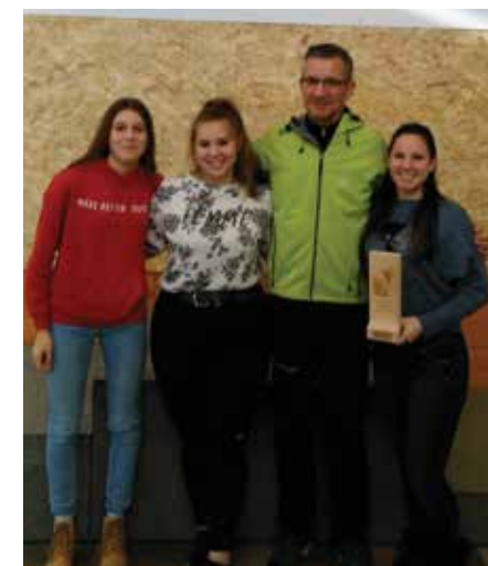
Uspešne dijakinje na strelskem tekmovanju