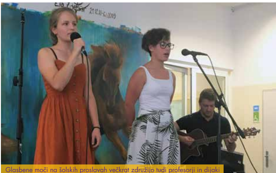
Glasbene moči na šolskih proslavah večkrat združijo tudi profesorji in dijaki

Dijaška skupnost Gimnazije in veterinarske šole (DS GVŠ) je skupnost vseh oddelkov na šoli. Njena osnovna funkcija je zastopati interese dijakov GVŠ. Na sestankih, ki potekajo enkrat mesečno, se dijaki pogovarjajo o dejavnostih na šoli in zunaj nje, izpostavljajo aktualne probleme na šoli, pripravljajo pa tudi raznorazne projekte, kot so natečaji ipd. Skupnost vsako leto organizira novoletno in pustno prireditev in tako popestri dogajanje na šoli. Šolska dijaška skupnost se vključuje tudi v DSL (Dijaška skupnost Ljubljana) in DOS (Dijaška organizacija Slovenije).