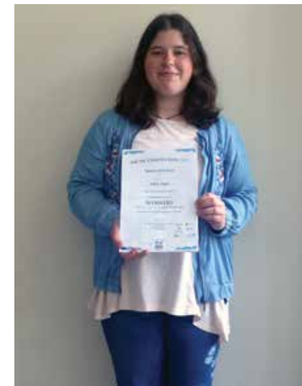
Naša dijakinja je zmagala na mednarodnem tekmovanju Arctic competition 2019 in skupaj z mentorico odpotovala na mednarodno polarno odpravo na sever Norveške.

Dijaki športniki zastopajo šolo na športnih tekmovanjih. Udeležujejo se tekmovanj v košarki, odbojki, atletiki, streljanju, plesu, orientacijskem teku in drugih športih.