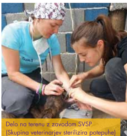
Delo na terenu z zavodom SVSP (Skupina veterinarjev sterilizira potepuhe)